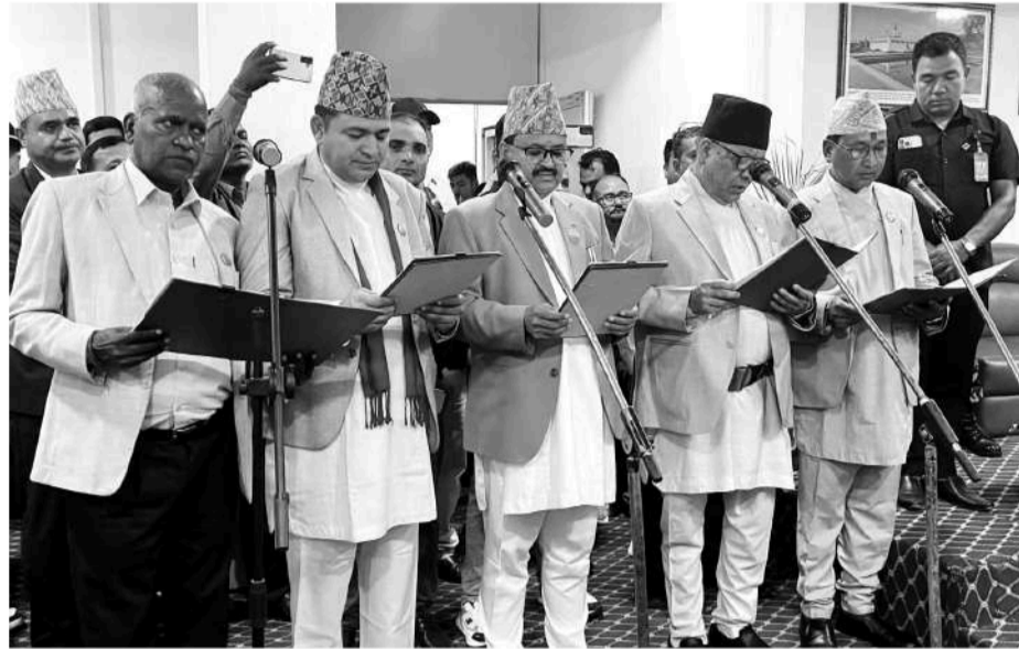
नवनिर्वाचित मन्त्रीहरू शपथग्रहण गर्दै।