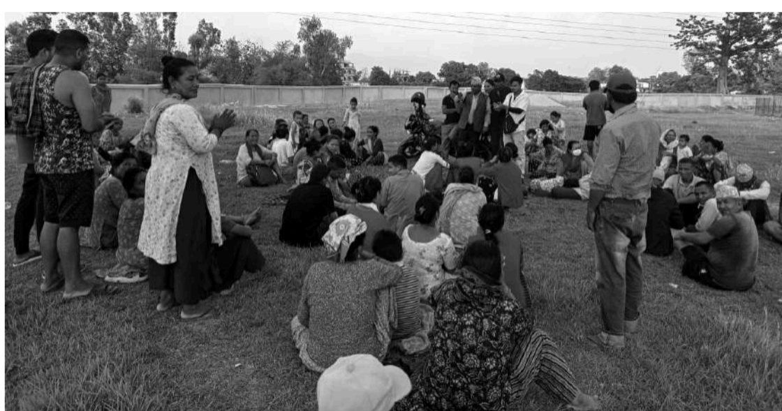
दीर्घकालीन व्यवस्थापनको माग राखी भेला भएका अवस्थित बसोबासी।